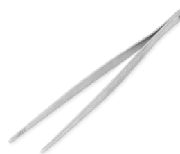
WEBER "GRILLPINCET" PRIS EKSKL. MOMS KR. 128,-