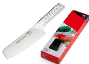
WEBER STYLE GRØNTSAGSKNIV PRIS EKSKL. MOMS KR. 198,-