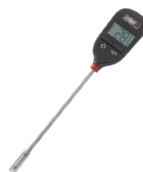
WEBER TERMOMETER INSTANT-READ PRIS EKSKL. MOMS KR. 128,-