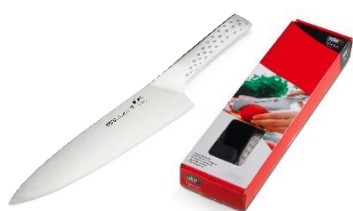
WEBER STYLE KOKKEKNIV PRIS EKSKL. MOMS KR. 268,-

... OG SÆT FOKUS PÅ DIN VIRKSOMHED, HVER GANG DER GRILLES