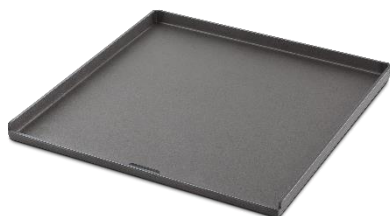
Weber CRAFTED Grillplatte / Plancha: 139,99 Euro