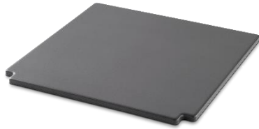
Weber CRAFTED Glasierter Grillstein: 109,99 Euro