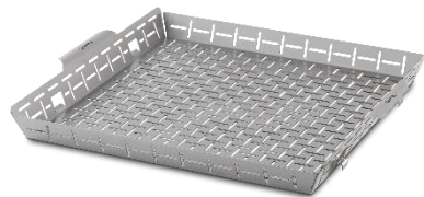
Weber CRAFTED Grillkorb: 69,99 Euro

FÜR EINE EXKLUSIVE AR-EXPERIENCE SCAN- NEN SIE DEN QR-CODE: