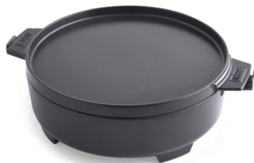
Weber CRAFTED Wok & Dampfgarer: 139,99 Euro

Das WEBER CRAFTED Gourmet Barbecue System Zubehör ist im Handel oder auf weber.com ab Frühjahr 2022 zu folgenden UVPs erhältlich: