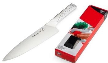
WEBER STYLE KOKKEKNIV PRIS EKSKL. MOMS KR. 335,-

... OG SÆT FOKUS PÅ DIN VIRKSOMHED, HVER GANG DER GRILLES