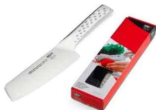
WEBER STYLE GRØNTSAGSKNIV PRIS EKSKL. MOMS KR. 248,-