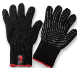
WEBER PREMIUM HANDSKESÆT S/M ELLER L/XL PRIS EKSKL. MOMS KR. 310,-